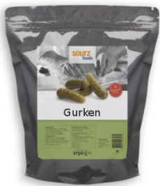
Gurken im Alu Zip-Beutel