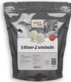
Silber Zwiebeln im Alu Zip-Beutel