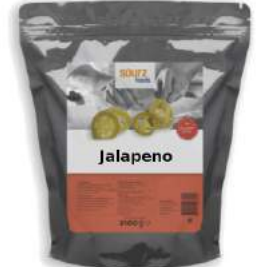
Jalapeno im Alu Zip-Beutel