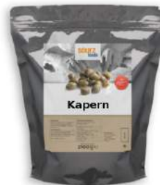
Kapern im Alu Zip-Beutel